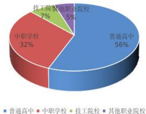
平顶山高中阶段职普招生比情况