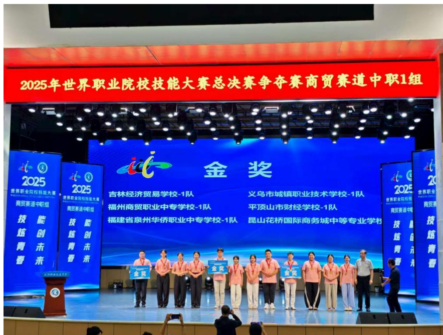
图表 3 2025 年平顶山市财经学校参加世界技能大赛获金奖