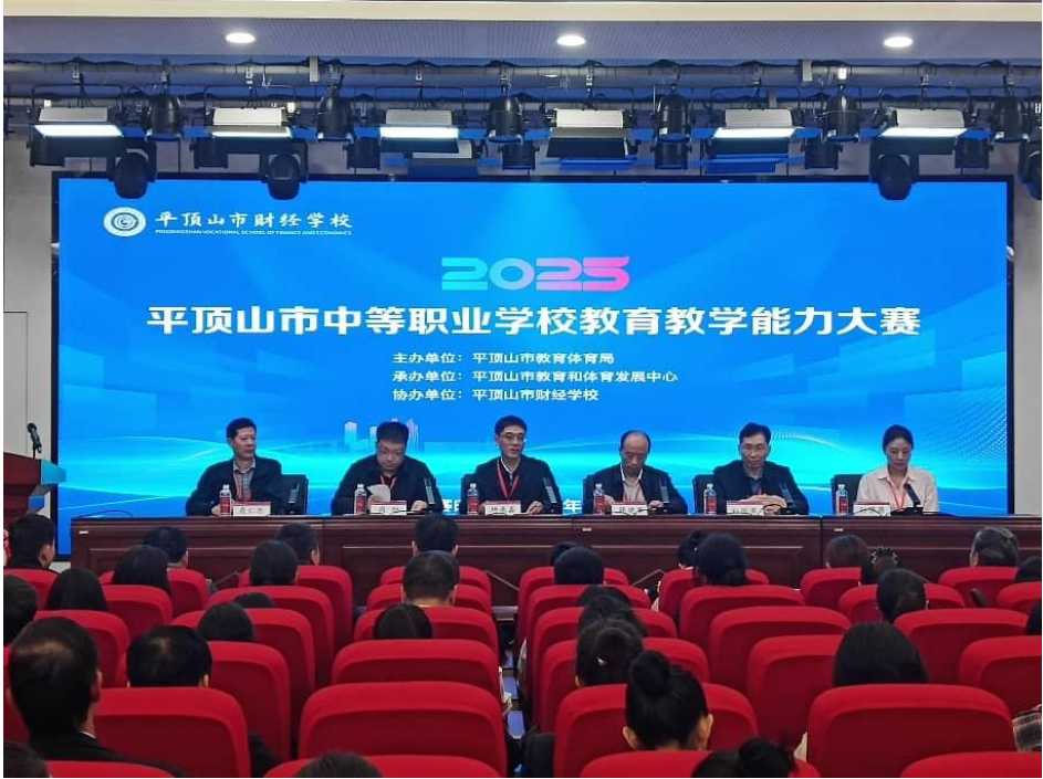
图表 6 2025 年平顶山市中等职业教育教学能力大赛开幕式

赛证”综合育人，进一步贯彻落实“提质培优、增值赋能”职业教育高质量发展的要求，举办 2025 年平顶山市中等职业教育教学能力大赛。经过校级选拔、市级网络评审和现场决赛，共评出一等奖 6 个、二等奖 10 个、三等奖 12 个。组织参加省级教育教学能力大赛，2 组获省级二等奖，5 组获省级三等奖。