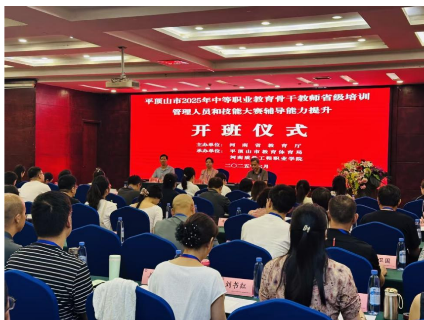
图表 7 平顶山市 2025 年中等职业教育骨干教师省级培训管理人员和技能大赛辅导能力提升开班仪式

中等职业教育质量，通过安排教师外出交流学习、培训进修、专家讲座等多种形式，提高教师的教科研水平和实践能力。本年度，组织中等职业学校 93 名教师参加国家级培训，564 名教师参加省级培训，组织 1145 名教师参加市专任教师全员培训。