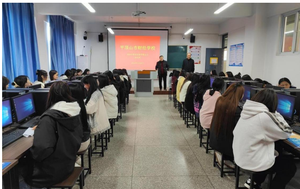
图表 5 平顶山市职业院校职业技能等级认定考核现场

高质量推进“人人持证、技能河南”建设工作，持续开展职业技能提升行动，依托全市职教资源，抢抓机遇，突出特色，狠抓基地建设，强化技能培训，全力推进全民技能振兴工程，发挥职业院校资源优势，广泛开展职业技能培训。2025 年全市中等职业学校累计开展职业技能培训 5610 人次。