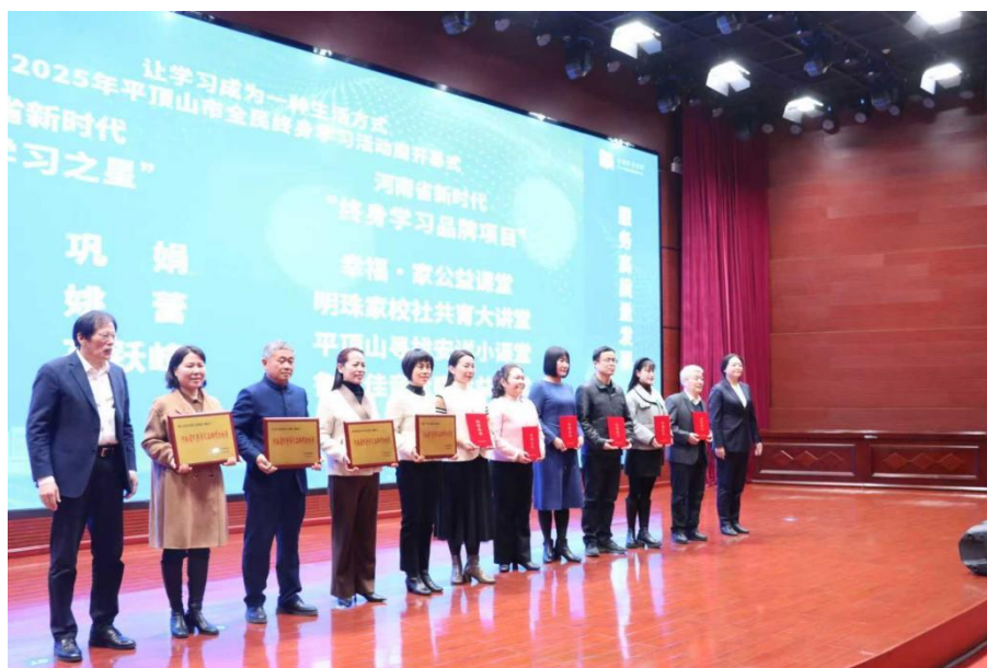
图表 4 2025 年平顶山市全民终身学习活动周开幕式

高质量举办 2025 年平顶山市全民终身学习活动周开幕式，活动由平顶山市教育体育局、平顶山市民政局、平顶山市农业农村局、平顶山市文化广电和旅游局、平顶山市退役军人事务局、平顶山市总工会主办，平顶山市教育和体育发展中心、平顶山学院承办。各县（市、区）教体局分管负责同志、职成教股负责人，各高校、高职院校、中职学校分管副校长、办公室负责人，各社区大学、老年大学、社区学院负责人，以及 2025 年河南省和平顶山市“百姓学习之星”“终身学习品牌项目”代表，行业主管部门、协会和新闻媒体等 160 余人参加了开幕式。2025 年平顶山市获得省级“终身学习品牌项目”4 个，省级“百姓学习之星”6 个。